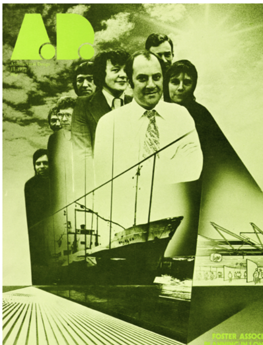
Foster Associates in Architectural Design, 1972.