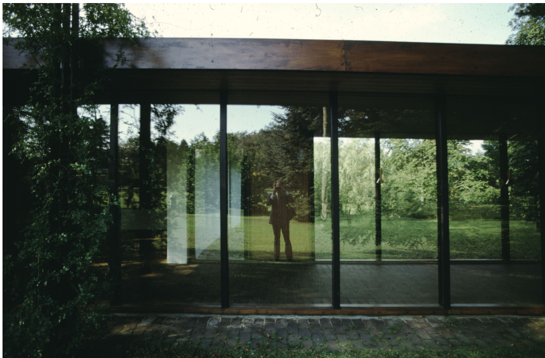
Jørgen Bo and Vilhem Wohlert, Louisiana Museum of Modern Art, Humlebæk, Dinamarca. Fotografiado por Norman Foster en 1974.