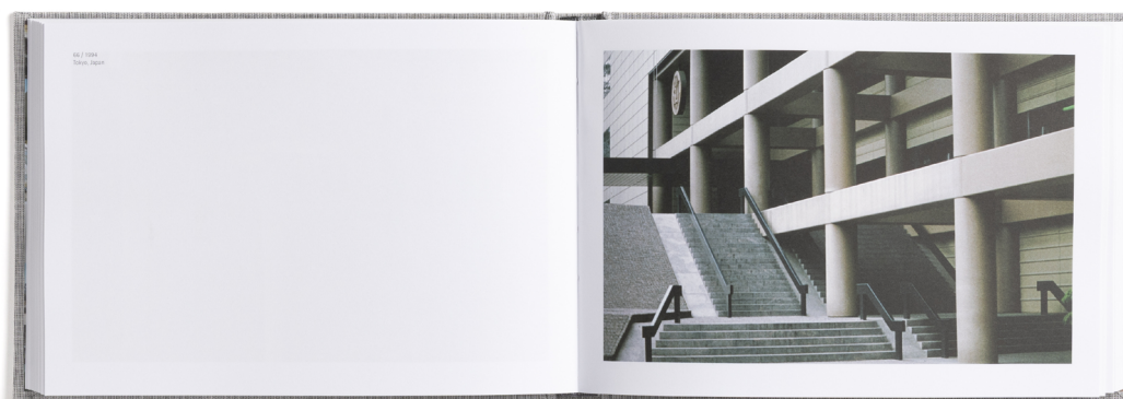
Tokio, Japón. Fotografiado por Norman Foster en 1994.

Norman Foster (Manchester, 1935) es fundador y Presidente Ejecutivo de Foster + Partners. Durante las últimas cinco décadas, el estudio ha diseñado planes urbanos, infraestructuras públicas, aeropuertos, edificios cívicos y culturales, oficinas, viviendas privadas y mobiliario. Entre los principales proyectos, destacan: el aeropuerto de Pekín, el viaducto de Millau en Francia, el 30 St Mary Axe (también conocido como el Gherkin) y el Great Court del British Museum en Londres, la torre Hearst en Nueva York y el Museo de Bellas Artes de Boston. Entre sus proyectos más recientes figuran el Apple Park de California, la sede europea de Bloomberg en Londres, la Torre Comcast de Filadelfia y el Norton Museum of Art de Florida. Algunos de sus proyectos actuales son el 425 de Park Avenue en Nueva York, el museo Narbo Via en Narbonne, el Magdi Yacoub Global Heart Center en el Cairo, el Community Boathouse en Harlem y la Torre de JP Morgan Park Avenue en Nueva York. Es presidente de la Norman Foster Foundation, con sede en Madrid y alcance mundial, que promueve el pensamiento interdisciplinar y la investigación para ayudar a las nuevas generaciones de arquitectos, diseñadores y urbanistas a anticiparse al futuro. Lord Foster del Thames Bank fue nombrado miembro de la Orden del Mérito por la Reina Isabel II en 1997, es presidente del Royal Fine Art Commission Trust y dirige el Forum of Mayors para las Naciones Unidas.